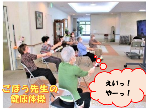
ごぼう先生の健康体操