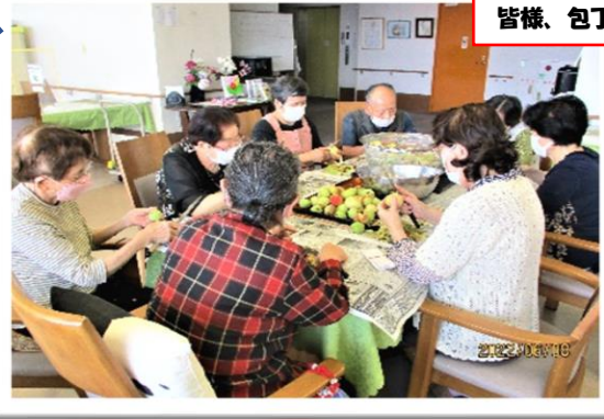
皆様、包丁片手に 真剣です。