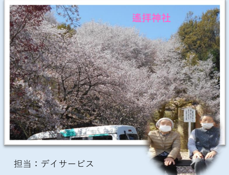
担当：デイサービス