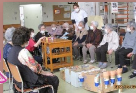
(デイサービス 介護職員)