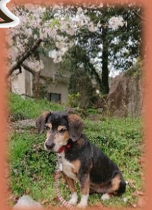
(居宅ケアマネジャー)